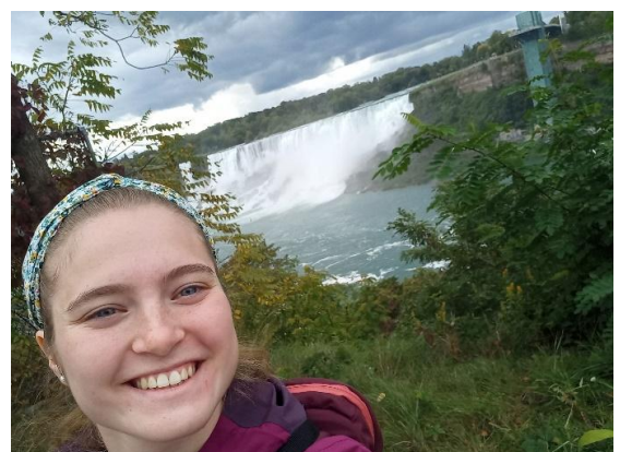
M. Mayer Niagarafälle

Mein letzter Stopp ist eine kleine Schaffarm, ebenfalls am „Arsch der Welt“. Hier sind die Geburt kleiner Lämmer und ein warmes Feuer im Ofen die Highlights des Tages die ich nur ungern misse. Den Abschluss dieser Reise bildet ein Roadtrip durch den Süden Ontarios. Auf der Route liegen Kingston, der Algonquin National Park, Lake Huron, Kitchener, Hamilton und mehr. Alles in Allem ein einzigartiges Erlebnis, welches ich froh bin, erlebt zu haben.